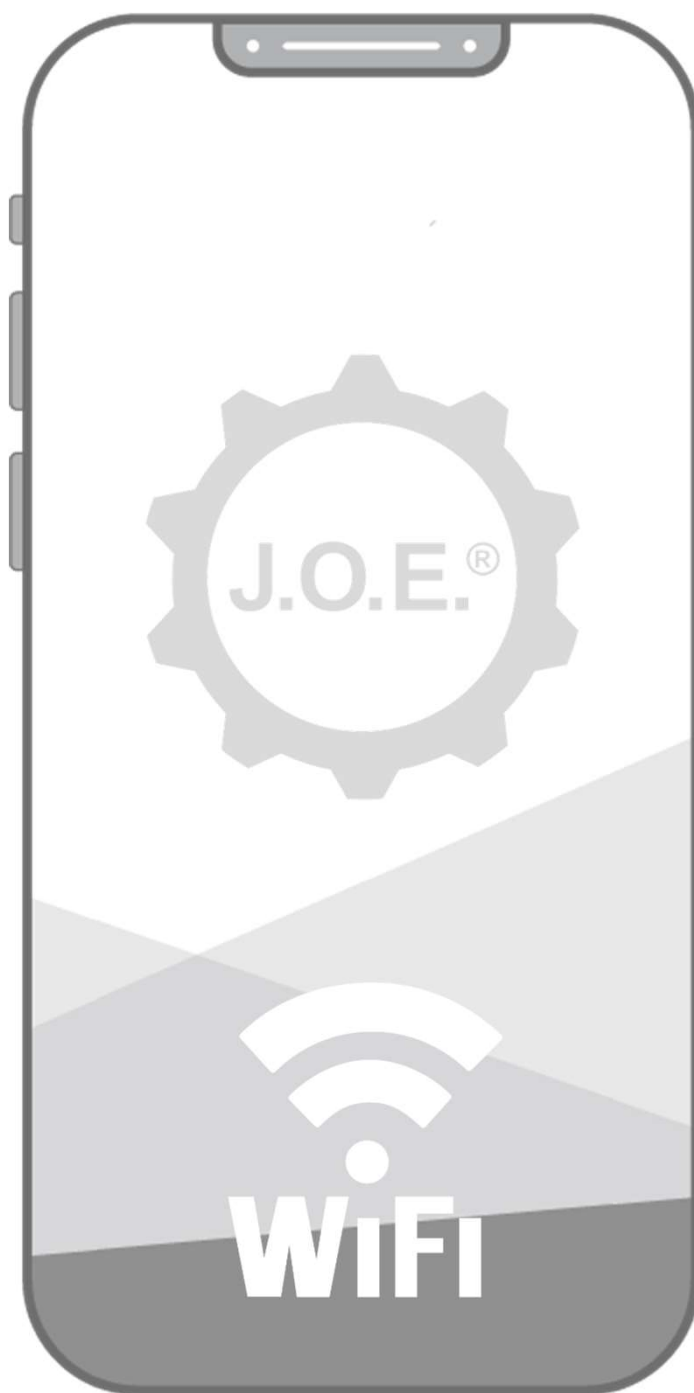
Aplikacja J.O.E.® 3.1